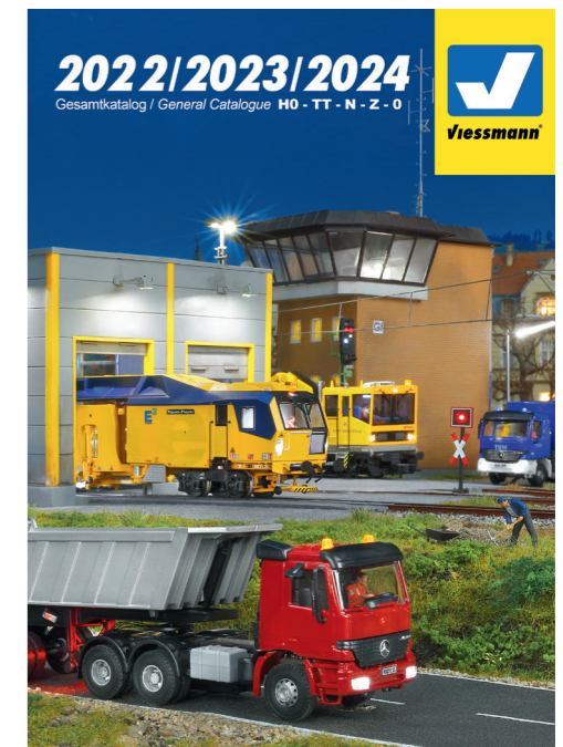
8999 Viessmann Katalog 2022/2023/2024 DE/EN Viessmann catalogue 2022/2023/2024 German/English